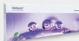
Proefpakket, 5 katheters.

*Effectieve lengte, lengte van de katheter die in de plasbuis kan worden ingebracht.